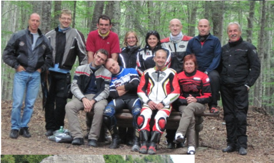
FOTO DI GRUPPO ALLA PIETRA DI BISMANTOVA