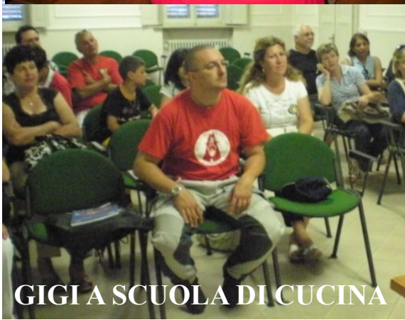
GIGI A SCUOLA DI CUCINA

Il giornale " La Strada " è redatto e pubblicato dai soci del Motoclub Pandino, quale strumento informativo interno alla società e ad uso esclusivo dei soci stessi. Distribuzione gratuita ai soci con scadenza mensile.